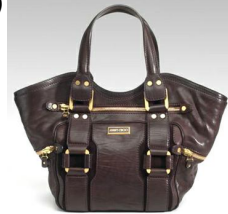
the bag, purse