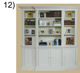
bookcase or shelves