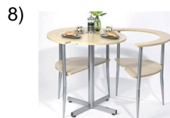
the little table