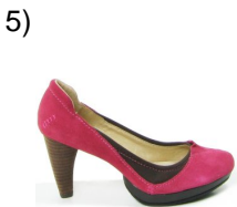
some short heeled shoes