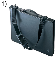
purse, pocket-book, portfolio

Words to Match: el pantalón - chaqueta - anteojos - los tacones - las botas - la bufanda - las gorras - el abrigo - la blusa - los lentes - la pijama - el zapato - el traje de baño - la camisa de vestir - la cartera - unos zapatos de tacón bajo - los calcetines - el suéter - el calzado - la bota - las pantuflas - la camiseta - la bata - los chales - la sandalia - los zapatos tenis - los jeans - bufandas - el vestido - la falda - las pulseras - boutique