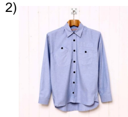
formal dress shirt