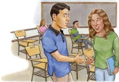
delighted to meet you (f)