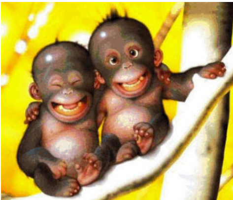
How are you?