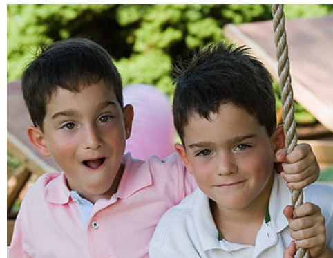
This is my friend (boy)