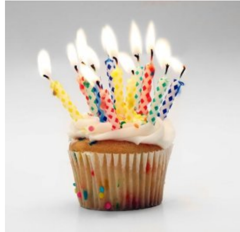
How old are you?